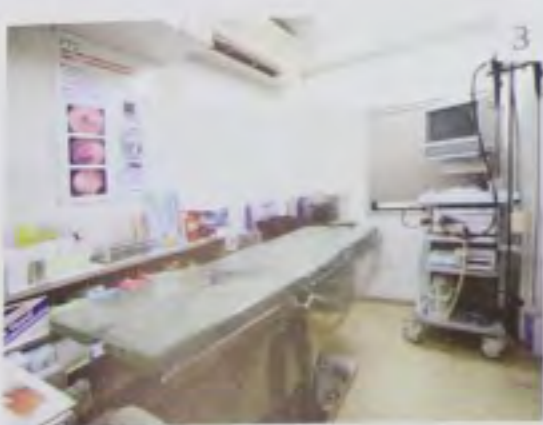
3. 経鼻内視鏡の他、超音波、レントゲン、心電図など検査設備が充実

Profile 1984年北里大学医学部卒業。大学病院時代は麻酔科や救命救急センターにも勤務。外科医として整形外科や脳外科、泌尿器科、産婦人科などで数多くの手術を執刀。2003年、父の跡を継ぎ院長に就任。日本外科学会専門医、日本消化器病学会専門医、日本消化器内視鏡学会専門医、日本消化器外科学会認定医など。休日は草野球やゴルフなどで汗を流す。スポーツは大切なリフレッシュ方法だそう。